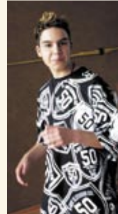
„Ich finde das hier ganz nett.“ Hagen

vermögen und eine gewisse Vorstellung über das Verhalten der Tiere, aber auch Experimentierfreude mit den ausgewählten Instrumenten.