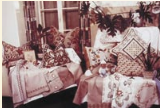
Handarbeitsausstellung – das Ergebnis trainierter Fingerfertigkeit

Ein erster grundlegender, struktureller Wandel vollzog sich in den sechziger Jahren. Mit dem Neubau wurde das Gruppensystem im Reinhardshof ausgebaut. Eine Gruppe war im Obergeschoss des neuen Schulgebäudes untergebracht, im Hauptgebäude wurde im Obergeschoss und im Dachgeschoss