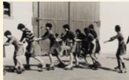
Spiele im Gänsemarsch

Im Laufe der Jahre hat sich mancher Wandel im Reinhardshof vollzogen. Sowohl im äußeren Erscheinungsbild wie auch in der pädagogischen Arbeit hat jede Epoche ihre Einflüsse und Spuren hinterlassen.