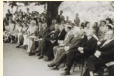
Tanz- und Gymnastikdarbietungen zur 70-Jahr-Feier

An den Gebäuden lässt sich dies gut nachvollziehen. Das alte Hauptgebäude aus der Kaiserzeit, die Anbauten aus den sechziger und Neubauten aus den siebziger Jahren des 20. Jahrhunderts zeigen hier den Spannungsbogen.