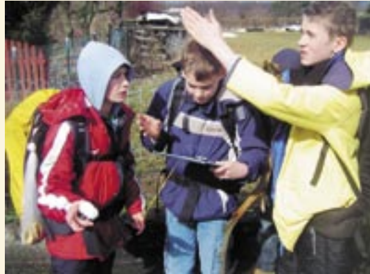
Gemeinsam Wege finden

Im 5. Schuljahr sind die Schüler in der Lage, auch über einen längeren Zeitraum eigenständig zu arbeiten. Dies müssen sie ganz besonders bei der Werkstattarbeit unter Beweis stellen, bei der sie eine Woche lang an einer Aufgabe arbeiten.