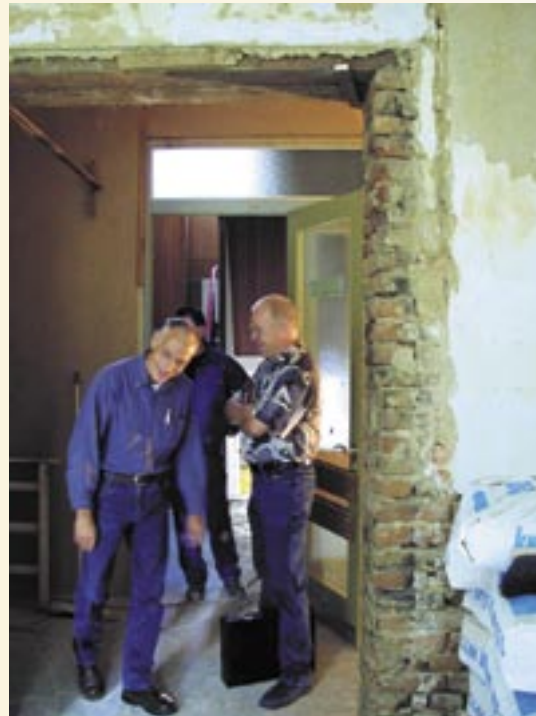
Die Fortschritte beim Umbau werden inspiziert

Ab 2003 wurde der alte Reinhardshof runderneuert. Das Erdgeschoss wurde grundsaniert und als Zentralverwaltung