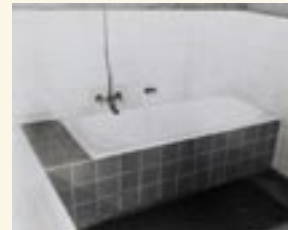
Einzel- und Zweibettzimmer waren noch nicht vorgesehen ...