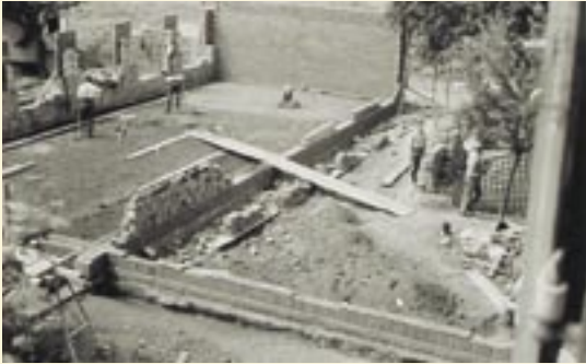
Baubeginn für das neue Schulgebäude