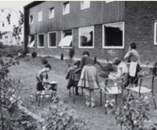
Unterricht im Freien ... und in der neuen Schule